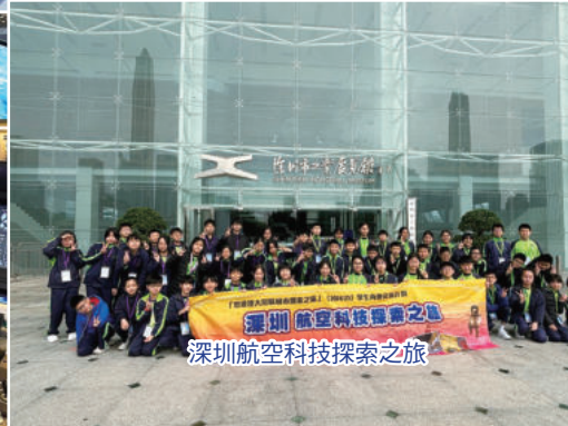
深圳航空科技探索之旅