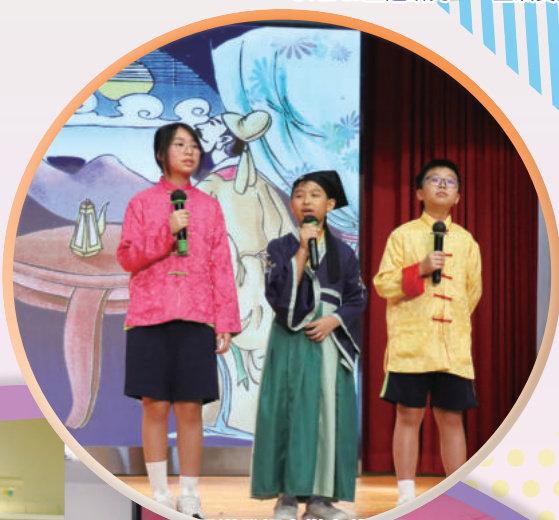
月滿登輝童樂中秋