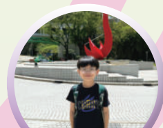
資優課程——香港科技大學「優才增益課程」