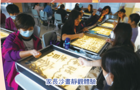
家長沙畫靜觀體驗