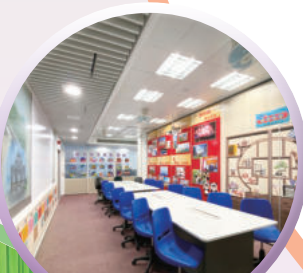
國民及國安教育中心