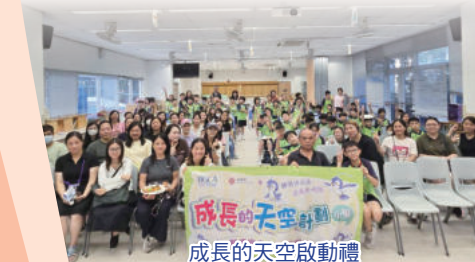
成長的天空啟動禮