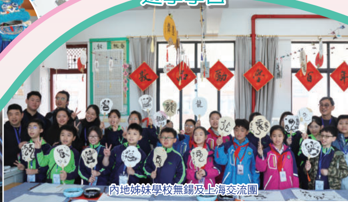
內地姊妹學校無錫及上海交流團