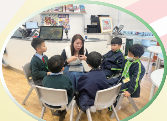
閱讀文化——故事爸媽