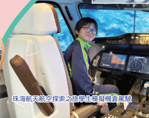
珠海航天航空探索之旅學生模擬機倉駕駛