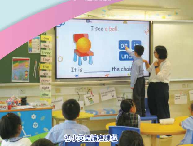
初小英語讀寫課程