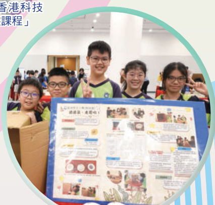
STEAM主題研究——空氣質量