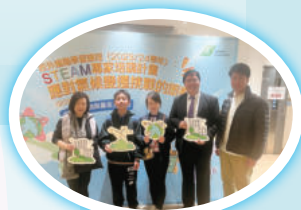
資優教育—— 香港教育大學STEAM 專家培訓計畫