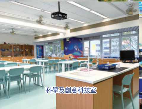
科學及創意科技室