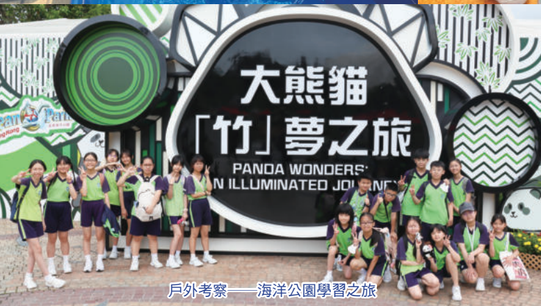
戶外考察——海洋公園學習之旅