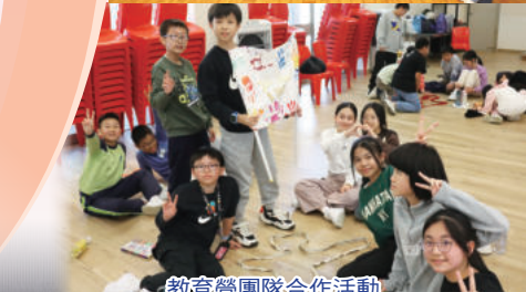
教育營團隊合作活動