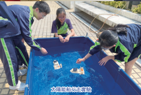
太陽能船行走實驗