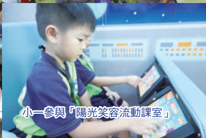
小一參與「陽光笑容流動課室」